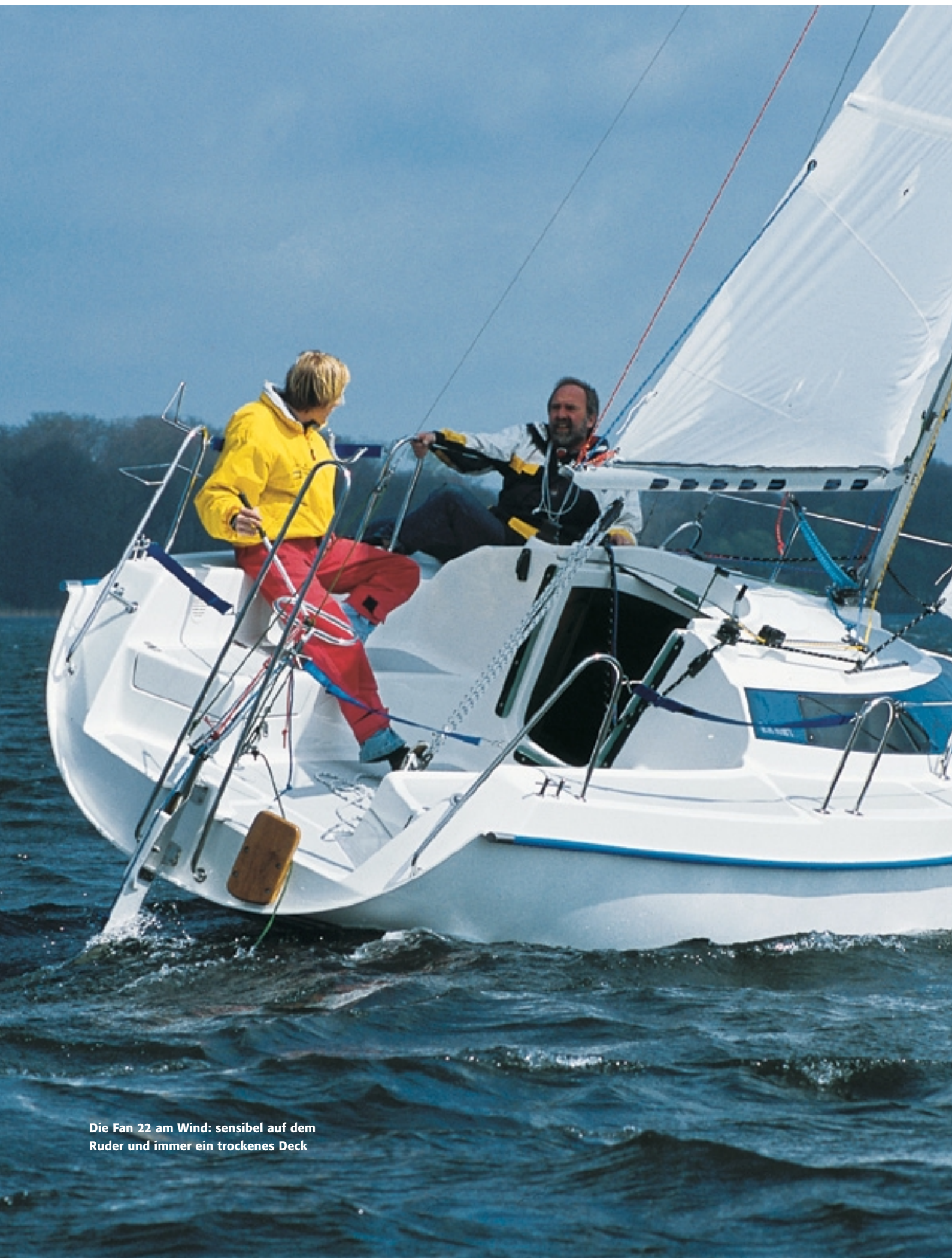
Die Fan 22 am Wind: sensibel auf dem Ruder und immer ein trockenes Deck