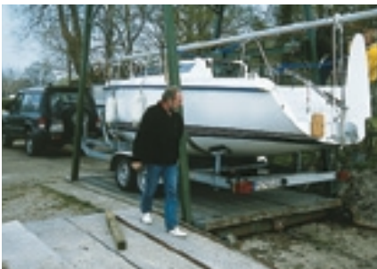
Knapp eine Stunde vorm Ablegen: Die Fan 22 wird per Trailer auf den Slip rangiert