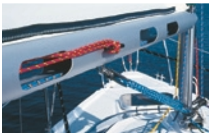
Wie auf größeren Racern: Der Baum ist aus Gewichtsgründen aufgeschnitten

Viel Innenausbau mit mehr Platz als erwartet führt erstaunlicherweise nicht zu einem unästhetisch hohen Freibord. Verwechslungsgefahr mit einem Wasser-Wohnwagen besteht also kaum. Auch wenn das Verhältnis von Rumpflänge zu Rumpfhöhe bei kleinen Yachten automatisch eine kompaktere Silhouette produziert: Die für Kleinkreuzer typische, eher unschöne Hochbordigkeit hält sich im Falle der Fan 22 in Grenzen. Ein far-