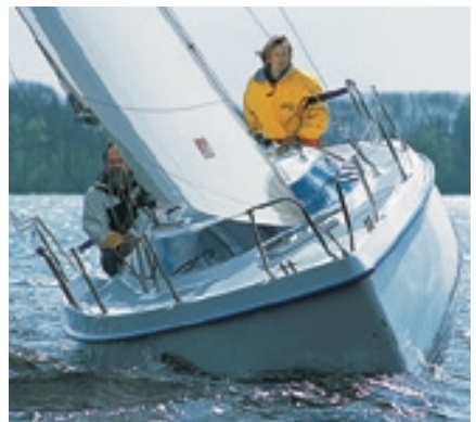
Seetauglich: Der archetypische Kleinkreuzer garantiert sichere Passagen

Als Erstes fallen die blitzenden Teile aus rostfreiem Stahl an Deck des Schwertkielers auf. Die Hersteller Skipper-Werft in Warschau und JAP in Radom/Polen haben offenbar ein Händchen für Edelstahlarbeiten. Neben kleinen, liebevoll geschweißten Klampen an Bug und Heck ist auch eine große, fest installierte Maststütze aus Niro nicht zu übersehen. Sie prangt mittig auf dem Spiegel des offenen Hecks, bietet den Gurten der Heckreling sowie den Beschlägen für das Achterstag Halt. Die Seiten der Stütze schmiegen sich außerdem an einen Bock aus GFK, durch den die Ruderbeschläge gebolzt sind. Diese Beschläge sowie der ganze Ruderkopf glänzen in poliertem Niro. Das schlanke Ruderblatt aus >