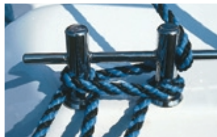
Wie bei den ganz Großen: Die Klampen in kräftigem Design sind filigran geschweißt