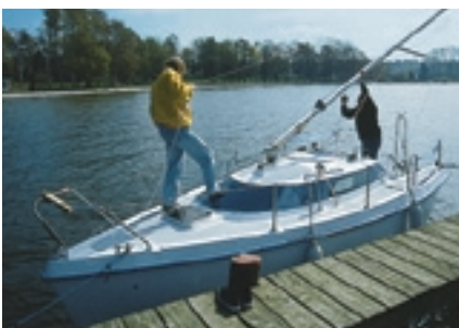
Eine Viertelstunde vorm Ablegen: Der geriggte Klappmast wird gestellt

GFK ist nach Jollenkreuzerart rauf- und runterzuklappen. Die Segel sind im Nu gesetzt, die durch hochwertige Beschläge von Barton nach achtern umgelenkten Fallen ermöglichen auch das Einhandskippern.