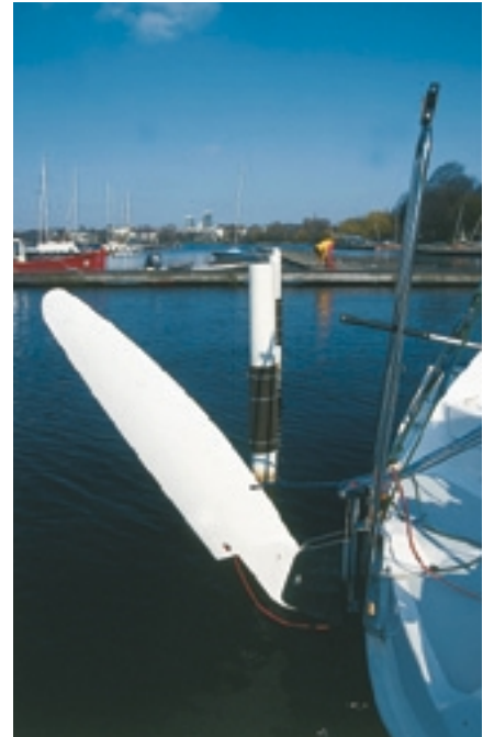
Schlank: Der Ruderblatt ist nach Art vieler Jollenkreuzer aufholbar. Beim Segeln ragt es senkrecht nach unten. Es ist jedoch etwas zu stark vorbalanciert

Kleine Boote sind arbeitsintensiv, sie binden während des Designstadiums fast genauso viel Kapazität wie große Yachten. Allein Ästhetik und Platz gekonnt zu vereinen ist schon ein Kunststück. Die Schiffe exakt auf eine Zielgruppe zuzuschneiden ist sogar noch schwieriger, als ihre großen Schwestern im Markt zu platzieren. Schon wenige Zentimeter oder ein paar Kilo können dabei einen Entwurf komplett verändern. Bekommt die Konstruktion mehr Freibord oder Ballast, ist nicht nur der Charakter des Bootes ein anderer geworden als geplant, sondern das Resultat ist meistens ein vollständig anderer Typ Schiff: So kann aus sieben Meter Rumpf ein Klein- oder Jollenkreuzer, ein Kiel- oder Sportboot werden. Zudem sind kleine Einheiten für Werften wenig lukrativ. Phänomene, die große Firmen oft davon abhalten, viel in die >