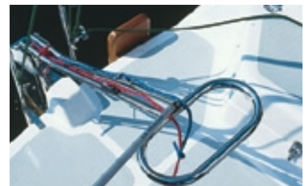
Wie bei den Edlen: Pinne, Ruderkopf und Maststütze glänzen in Niro-Stahl